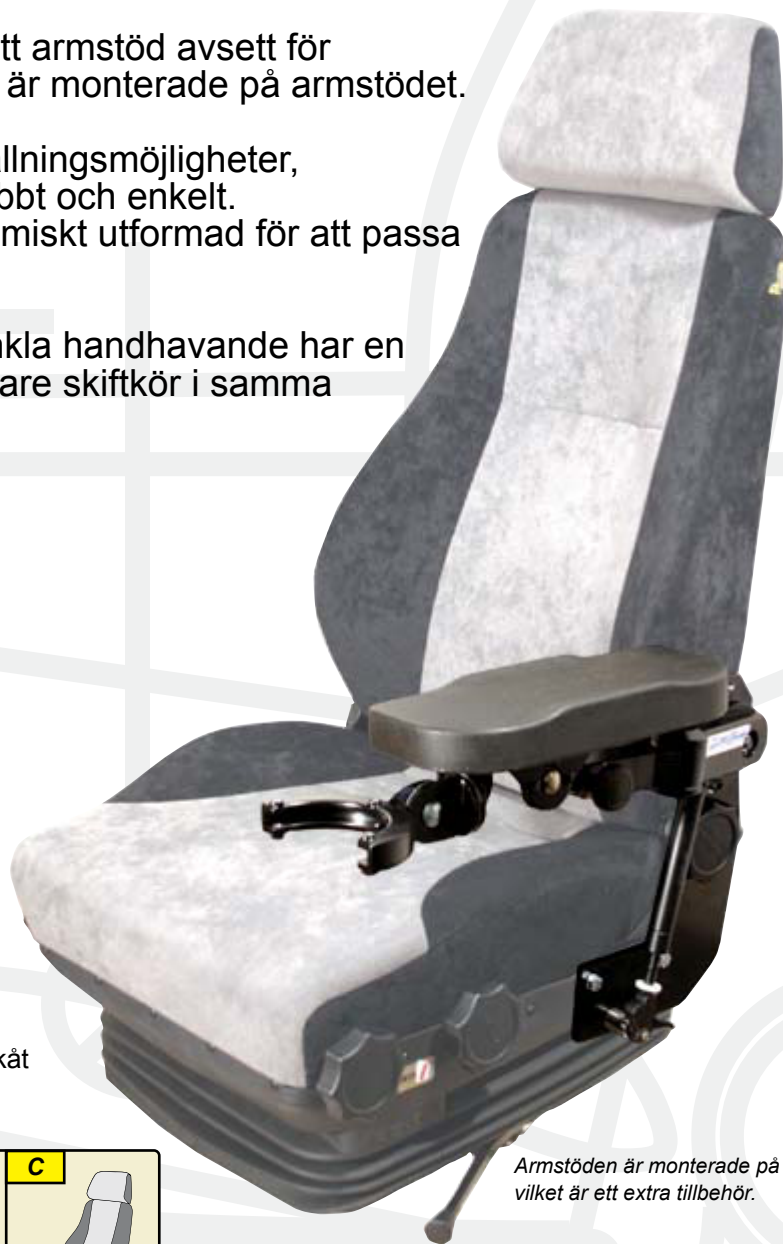
Armstöden är monterade på en beslagsats vilket är ett extra tillbehör.